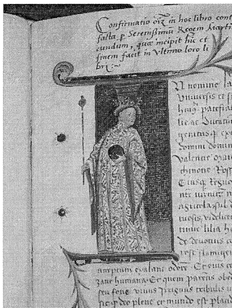
Ilustración 2. El infante Martín en el Códice Fundacional de Valldecris, Archivo de la Catedral de Segorbe. Manuscrito confeccionado el 17 de marzo de 1404 en Valencia, con la finalidad de confirmar los privilegios concedidos a la cartuja de Valldecris por su padre, Pedro IV, y por su hermano Juan I, y ratificar las concesiones hechas por Martín y su esposa María de Luna.