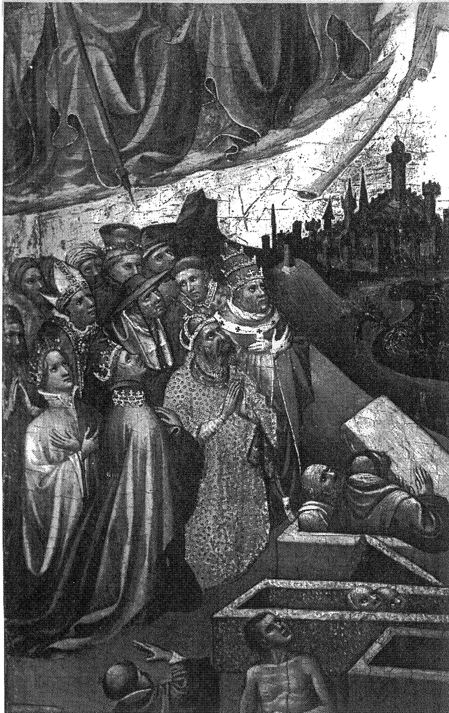
Ilustración 4. B. Detalle de la ilustración anterior.