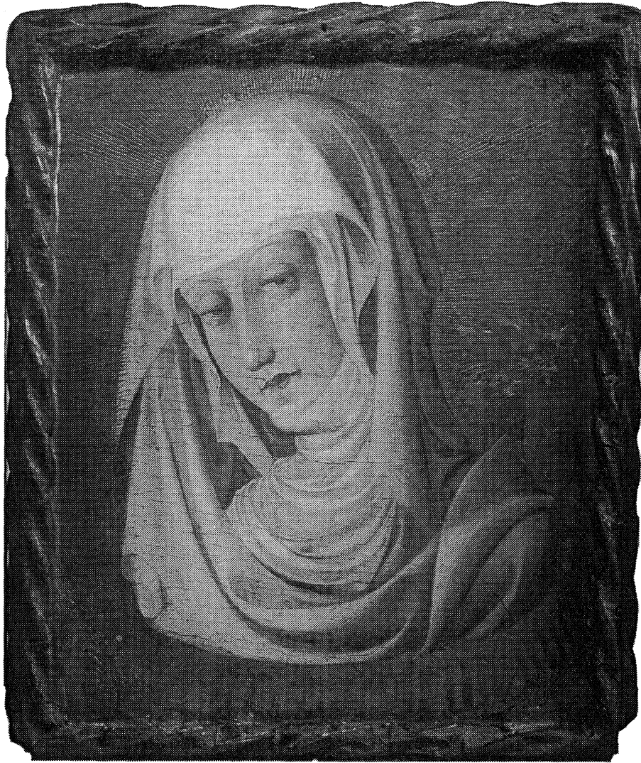
Ilustración 5. Verónica de la Virgen del Museo de Bellas Artes de San Pio V. Tabla doble atribuída a Pere Nicolau que se podría identificar con la imagen de la Virgen que Martín I regaló al monasterio de Valldecris.