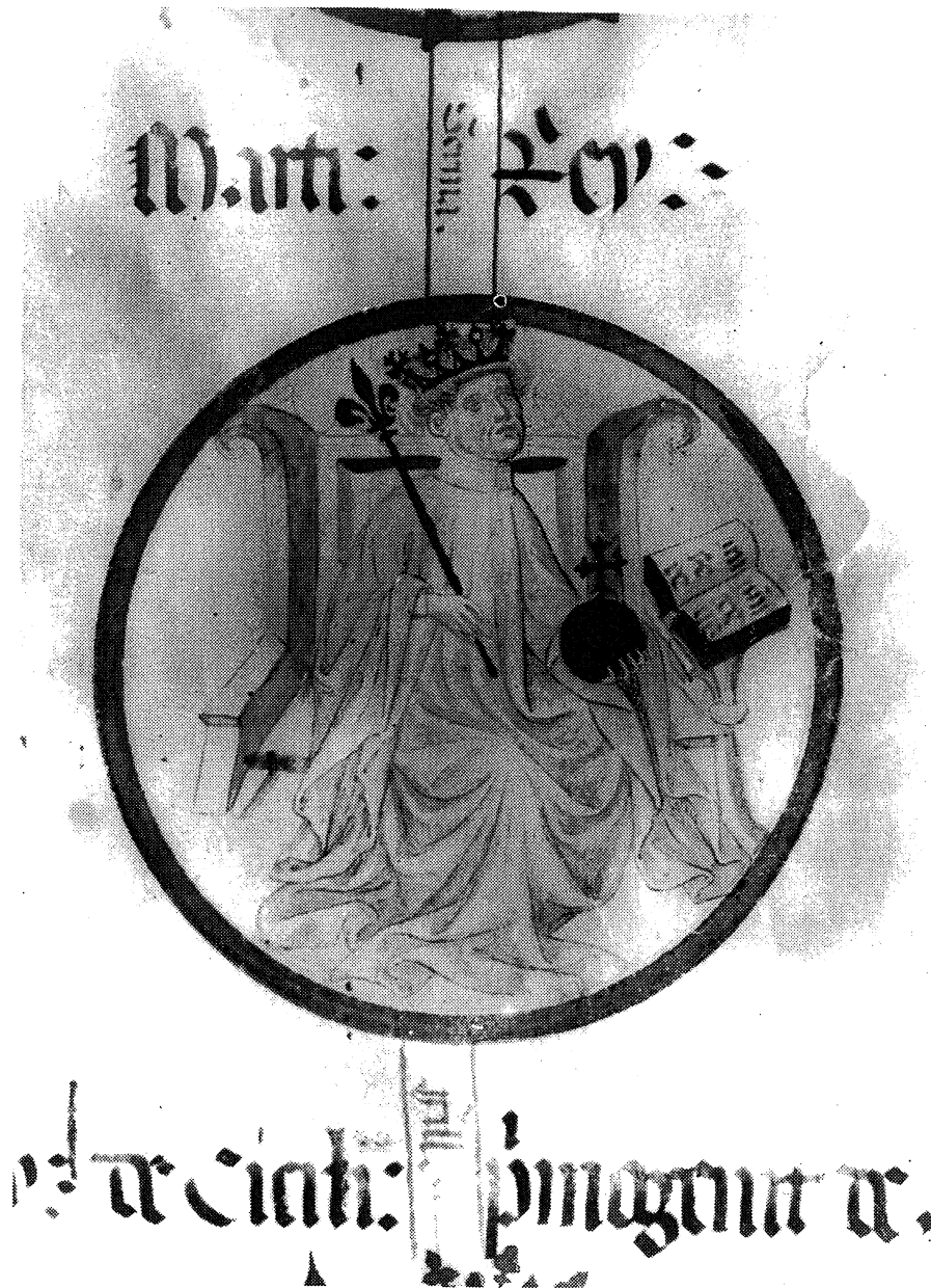
Ilustración 1. Martín I en el Rollo Genealógico del Monasterio de Poblet. Tras el matrimonio de Martín con María Luna, el rey Pedro IV otorgó al infante el título de conde de Jérica y de Luna y señor de la ciudad de Segorbe y supuso para el reino de Valencia la primera aproximación de Martín a los territorios del reino valenciano.