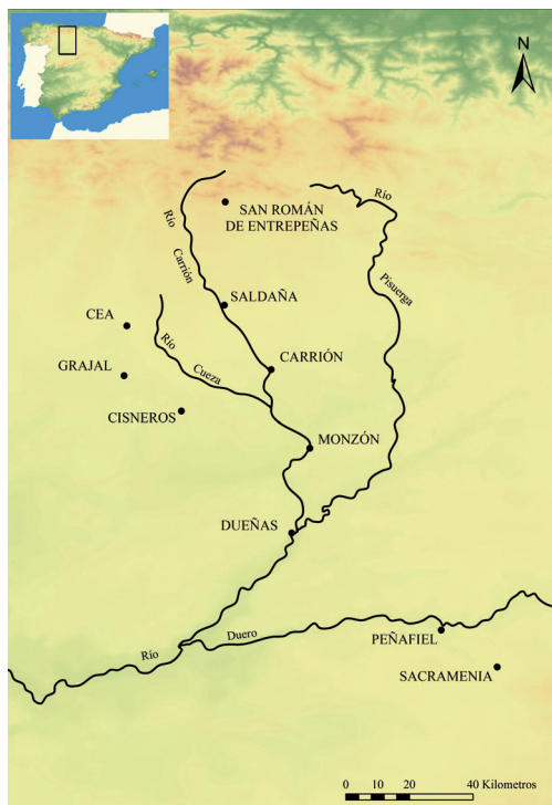
Fig. 1. Principales centros territoriales mencionados en el texto.

Para ello, es necesario revisar algunos de los planteamientos tradicionales y formular nuevas preguntas. Por ejemplo, como luego veremos, los historiadores han manifestado una gran preocupación por determinar el origen geográfico de los grupos aristocráticos. ¿Por qué se le atribuía tanta importancia a esta cuestión? Acaso porque, en un contexto historiográfico dominado por las ideas de reconquista y repoblación, su movilidad se interpretaba como indicador de los flujos poblacionales que supuestamente los nobles arrastraban a remolque de las campañas militares contra los musulmanes 11 . Sin embargo, una vez reconocida la pervivencia de comunidades de población en la meseta del Duero y de fórmulas de organización socioespacial anteriores a la implantación del reino asturleonés, el origen geográfico de estas élites pierde importancia. No toda, pero sí la suficiente como para dar mayor relevancia a factores más interesantes, tales como su posición social inicial y el contexto en que alcanzaron cierta preeminencia, u otros como la capacidad y los límites de acción y de proyección de su poder. A ello se suman las preguntas sobre las condiciones y consecuencias de su integración en el marco institucional del reino, sobre la interacción con los monarcas asturleonenses, etc.