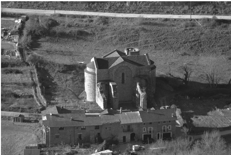
Fig. 1. Restes de l'antiga església abacial de Tavèrnoles.

pocs quilòmetres de la Seu, va ser un destacat actor polític durant el període medieval i, almenys a partir del segle XII, un notori contrapoder a l'ambició expansionista territorial i jurisdiccional dels veïns bisbes urgellencs. En aquestes pàgines voldria destacar, precisament, la rellevància institucional del cenobi i posar-la en relació amb dos objectes artístics d'especial volada: els dos frontals d'altar que van presidir, en èpoques successives, l'ornamentació del presbiteri de l'església abacial. Un d'aquests frontals, de plata, el coneixem només gràcies a les referències documentals i mai fins ara no havia rebut l'atenció de la historiografia. L'altre frontal, pictòric, es conserva al Museu Nacional d'Art de Catalunya i ha estat objecte d'alguns estudis d'interès, a les conclusions dels quals voldria només afegir algunes puntualitzacions, espero que oportunes. Fet i fet, es tracta de destacar el paper jugat per aquests dos mobles en la vida del monestir, no pas en la seva connatural funció litúrgica sinó com a objectes, respectivament, d'ús financer i de significació ideològica. Contra una certa visió excessivament sacralitzada dels ornamenta eclesiàstics, l'exemple d'aquestes dues taules constata la multiplicitat dels rols que juguen els objectes sacres i, en bona mesura, la preeminència dels condicionants polítics i econòmics que actuen sobre d'ells, tot sovint per sobre dels valors estrictament religiosos.