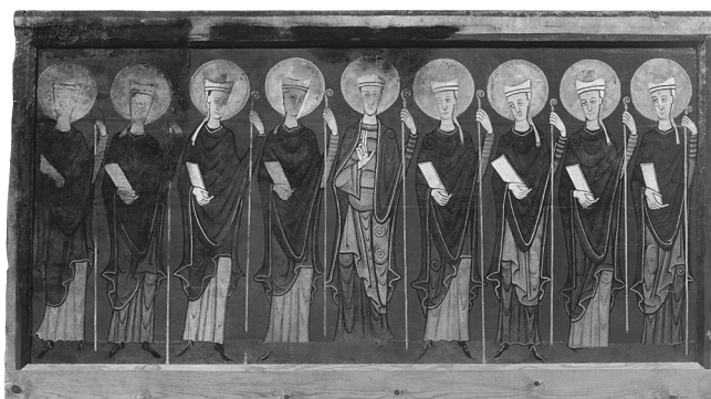
Fig. 2. Frontal d'altar de Tavèrnoles.

El frontal pictòric de Tavèrnoles ocupa un espai privilegiat al MNAC, a la primera de les sales dedicades a l'art romànic 2 . És una obra magnífica (fig. 2), amb qualitats per a reclamar una posició absolutament preponderant entre la pintura sobre taula del romànic català, no només per la seva exquisida execució tècnica 3 sinó també pel seu singular contingut iconogràfic i per l'original model de composició: en una escena única, mostra una sèrie alineada de nou sants bisbes, tots nimbats i amb bàcul i llibre a les mans, que s'ordenen en dos flancs de quatre i són presidits per una figura central lleugerament denotada; és l'única amb el rostre en posició frontal, vestidures distintes (duu mantell obert, per comptes de casulla), i amb la mà dreta fa el gest de beneir.